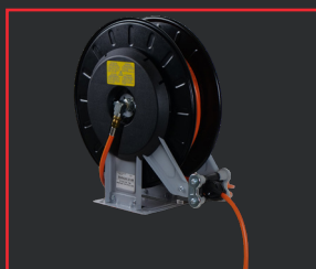
CARRETE DE MANGUERA DE GAS