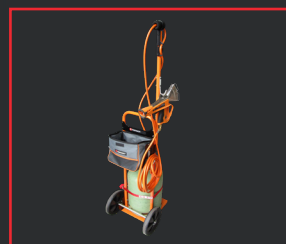
CARRO PORTA BOTELLAS 936