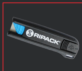
CÚTER DE SEGURIDAD EASYKNIFE