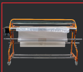
MÁQUINA DE SOLDADURA MULTICOVER