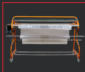
SOUDEUSE MANUELLE MULTICOVER 955