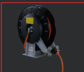
CARRETE DE MANGUERA DE GAS