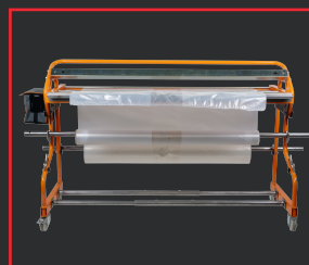
SELLADORA MANUAL MULTICOVER 955