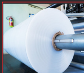
STANDARD-PALETTENABDECKUNG (80X120 UND 100X120)