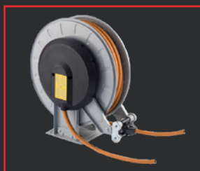
CARRETE DE MANGUERA DE GAS