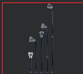
EXTENSIONES PARA PISTOLAS