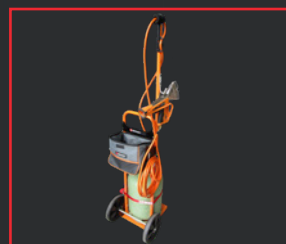
CARRO PORTA BOTELLAS 936