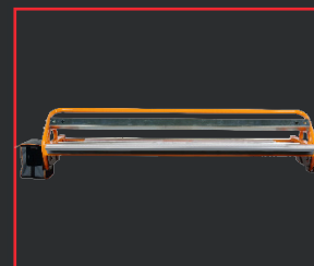
TÊTE DE SOUDURE MULTICOVER