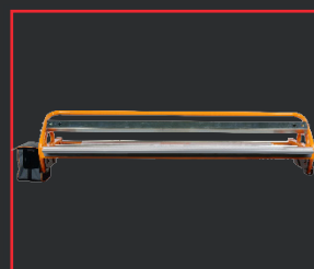
TÊTE DE SOUDURE MULTICOVER