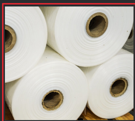
SCHLAUCHFOLIE MIT SEITENFALTEN