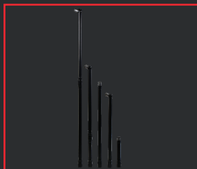
VERLÄNGERUNGEN FÜR RIPACK- SCHRUMPPPISTOLEN