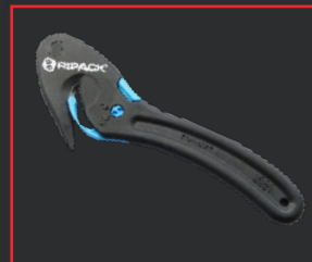
CÚTER DE SEGURIDAD SAFEKNIFE