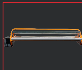
CABEZAL DE SOLDADURA MULTICOVER