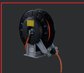
CARRETE DE MANGUERA DE GAS